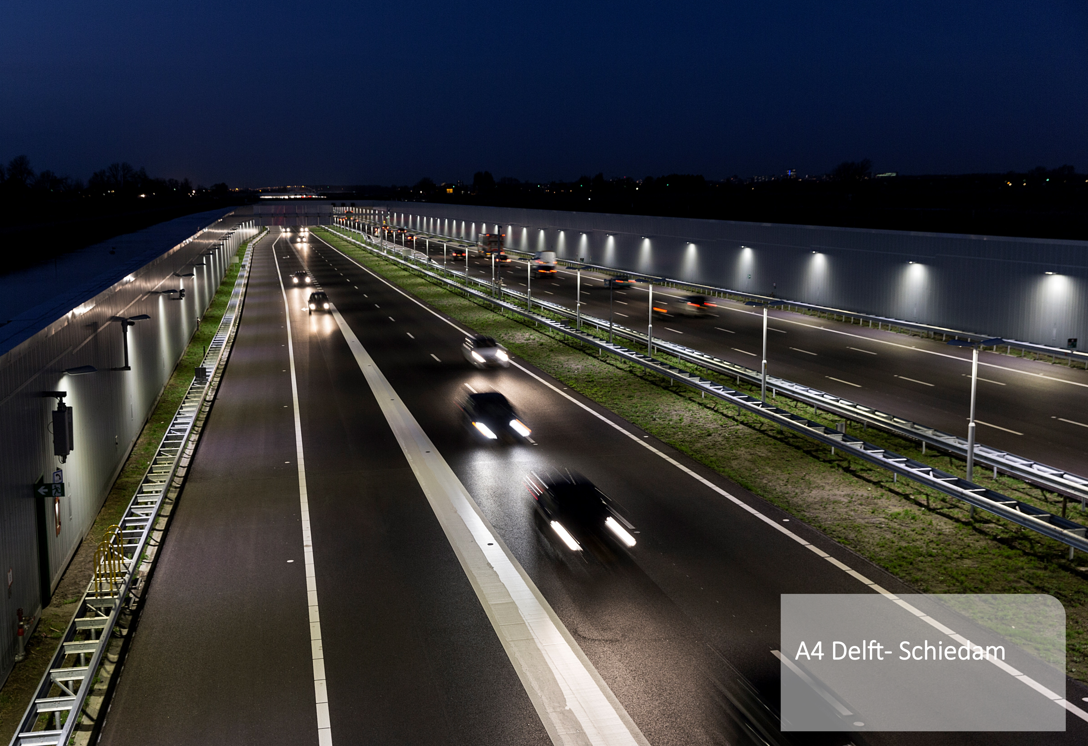
A4 Delft- Schiedam